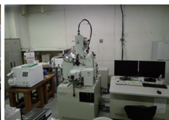
電子線マイクロ分析 EPMA