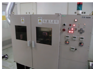
ホットオイル試験機