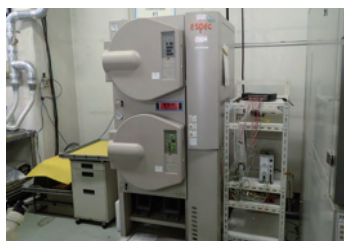
高温高湿高圧試験機