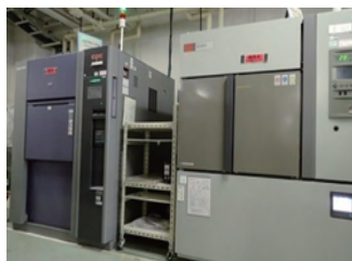
気槽式熱衝撃試験