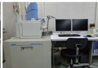
エネルギー分散型 X線分光分析機 (SEM-EDS)