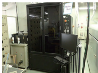
シャドウモアレ装置